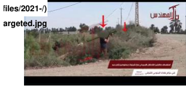
Figure 2: May 23, 2020 LTM video purporting to show the event in which a Chinook was targeted

يشير توقيت عودة ظهور "لواء ثار المهندس" إلى أنه جزء من تصعيد منسق على نطاق أوسع برعاية جميع الفصائل الرئيسية رداً على الضربات الجوية الأمريكية في 28 حزيران/يونيو 2021. وقد يشير ذلك إلى تلقّي التوجيهات من "الهيئة التنسيقية للمقاومة العراقية" (https://www.washingtoninstitute.org/policy-analysis/their-own-words-senior-leaders-admit-membership-tansiyaqiya).