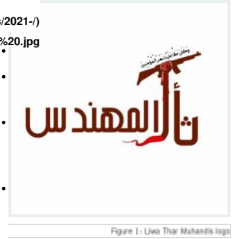
Figure 1: Liwa Thar Muhandis logo