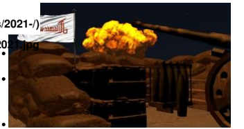
Figure 3: LTM graphic from July 7, 2021