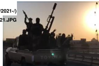
Figure 3: Video grab of militia with 23mm dining west outside I2, May 26, 2021

وأظهر فيديو ثانٍ رجال ميليشيا في عدة شاحنات صغيرة مزودة بمدافع مزدوجة مضادة للطائرات من عيار 23 ملم وقذائف صاروخية ويهدف هذا الفيديو إلى إظهار أن الميليشيات تتمتع بحضور قومي داخل «المنطقة الدولية» لكن وفقاً لمواقع المعالم تم التقاط الفيديو بوضوح على الطريق السريع خارج حدود «المنطقة الدولية» بينما كانت الشاحنات تبعد عن «المنطقة». (انظر إلى الشكل 3: مسجد الرحمن و«برج قريب يتجلبان أمام القافلة ويمينها وفي الفيديو نفسه «برج ساعة بغداد» وراء القافلة وجميعها تؤكد المواقع الموصوفة).