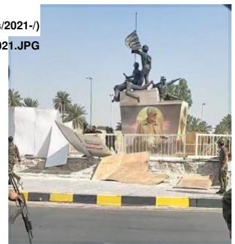
Figure 1: Militia demolish hoardings at July 14 monument, May 26, 2021

ويصف موقع «صابرين نيوز» (الشكل 2) رجال الميليشيات بأنهم «دخلوا المنطقة الخضراء» لكن في الواقع كانوا مجموعة صغيرة من الحراس المتواجدين أساساً داخل المنطقة. وفي منشورات أخرى رُوّج موقع «صابرين» لمزاعم خاطئة بأن الميليشيات طوّقت مكتب رئيس الوزراء في محاولة واضحة لإعادة إعطاء الشعور بان حادثة ترهيب رئيس الوزراء التي حصلت في حزيران/يونيو 2020 قد تكررت بتجنّج (05/Militia%20uynveil%20Muhandis%20poster%20at%20July%2014%20monument%2C%20May%2026%2C%202021.JPG)