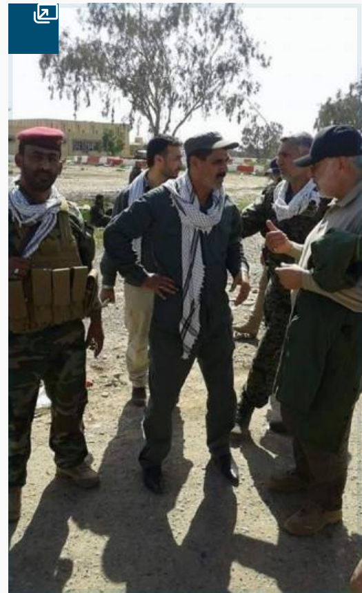
Fig 3: Sayyed Jabbar al-Musawi center, green cap) talks to Abu Mahdi al-Muhandis during the operations against the Islamic State, posted April 13, 2015

أحد مسؤولي القناة صورة (الشكل 4) ورد فيها اسم «كوادر حزب الله القدامى - العراق». وردّ المسؤول الآخر بكتابة: «أخي قم بتصحيح الاسم [إنها] «كوادر حزب الله القدامى» فقط احذف كلمة "العراق". وعلى ما يبدو هناك صلة وثيقة جداً بين «كوادر حزب الله القدامى» و«حزب الله» اللبناني