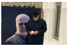
تعظيم الميليشيا لاسماعيل قانبي: من أجل تعزيز النفوذ أو تغطية الإحراج (ar/policy-analysis/tzym-almlyshya-lasmayl-qaany-mn-ajl-tzyz-alfwdh-aw-tghtyt-alahraj/)