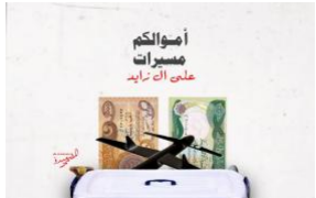
«كتائب حزب الله» وراء حملة التبرعات "الشعبية" في العراق لصالح اليمن (ar/policy-analysis/ktayb-hzb-allh-wra-hmlt-altbrat-alshbyt-fy-alraq-lsalh-alyymn/)

كيفية استخدام مقالات سلسلة "الأضواء الكاشفة للميليشيات" (ar/policy-analysis/kytyt-astkhdam-mqalat-sisit-alaadwa-alkasht-ilmlyshyayt/)