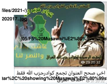
Fig 4: Message posted in KHQ's Telegram channel, August 22, 2017

أما الموسوي المتمركز في محافظة ذي قار فقد كانت له طموحات سياسية منذ فترة طويلة في عام 2010 ترشح ضمن قائمة "الائتلاف الوطني العراقي" لمنصب الأمين العام لـ «حركة مجاهدي الأهوار لحزب الله». وفي عام 2014 ترشح ضمن قائمة المالكي «ائتلاف دولة القانون» (الشكل 5).