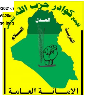
Fig 1: Kawader Hezbollah al-Qudama logo