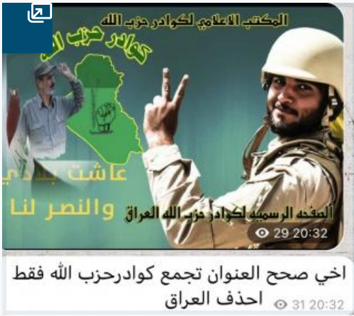
Fig 4: Message posted in KHO's Telegram channel, August 22, 2017

وفي عام 2018 اختار الموسوي "ائتلاف الفتح".