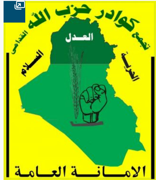
Fig 1: Kawader Hezbollah al-Qudama logo

العراق» كانوا متركزين في الأهوار إلى المحلّة الخاصة به في محافظة ذي قار وأسسوا حركتهم السياسية وحافظ الموسوي على علاقته مع رفاقه القدامى مثل أبو مهدي المهندس (الشكل 3).