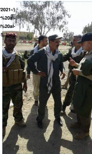
Fig 3: Sayed Jabbar al-Musawi center, green cap) talks to Abu Mahdi al-Muhandis during the operations against the Islamic State, posted April 13, 2015

وعلى ما يبدو هناك صلة وثيقة جداً بين «كوادر حزب الله القدامى» و«حزب الله» اللبناني حيث رفعت