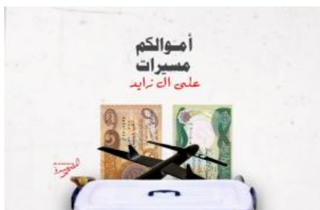
Kataib Hezbollah Behind "Grassroots" Iraqi Fundraising for Yemen

(/policy-analysis/how-use-militia-spotlight)