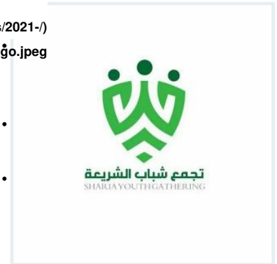
Sharia Youth Gathering logo

وفي دلالة واضحة على الانتماء إلى «كتائب حزب الله» تضمن الشعار الأولي لـ "جمعية كشافة الإمام الحسين" علم «الكتائب» كما أن أعضائها يعتمرون بانتظام قبعات ببسبول مطبوع