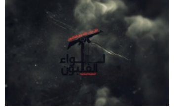
لمحة عامة: "لواء الغالبون" (ar/policy-analysis/lmht-amt-lwa-alghalbwn/)