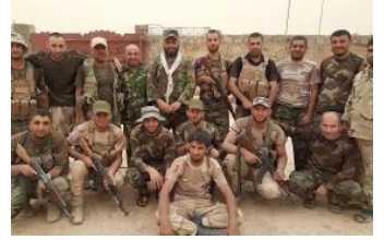
لمحة عامة: "حشد الشبك" "اللواء 30 (قوات الحشد الشعبي العراقي)" (ar/policy-analysis/lmht-amt-hshd-alshbk-allwa-30-qwat-alhshd-alshby-alaqy/)