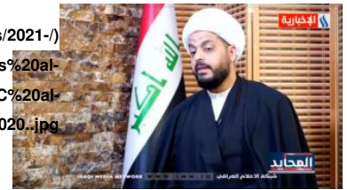
Qais al-Khazali, al-Iraqiya TV, November 19, 2020

وسأل مقدم البرنامج محيي عن الجهات الفاعلة الدولية التي لعبت دوراً في التوصل إلى هذه الهدنة فأجاب: "لعبت العديد من الأطراف دوراً في الهدنة إلا أنه كان للأطراف الإقليمية والمحلية دور كبير في التوصل إلى هذا الموقف. فهذا موقف مسؤول ولا يعني الخوف من الأمريكيين أو التنازل عن المبادئ. ما لنا نتمسك بمبادئنا ولهذا أعطيناهم هذه الفترة المشروطة وهذه الفرصة المشروطة".