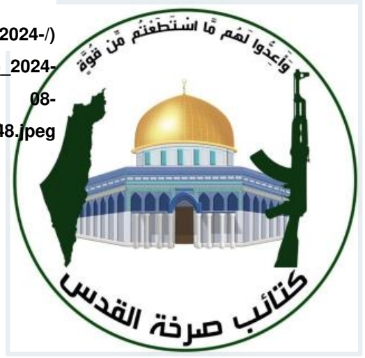
.Kataib Sarkhat al-Quds logo introduced on August 19, 2024

«كتاب صرخة القدس» المعروفة سابقاً باسم «أصحاب الكهف» هي أقدم جماعات الواجهة للمليشيات الحالية حيث ظهرت للمرة الأولى في عام 2019 وظلت نشطة باستمرار منذ ذلك الحين وفي أوساط العراقيين تُعتبر إحدى جماعات الواجهة الأكثر شهرة ويُستخدم اسمها أحياناً كاختصار لجماعات المليشيات الجديدة وتشير مقابلة أجريت في نيسان/أبريل 2023 ( https://aymennaltamimi.substack.com/p/targeting-us-forces-in-iraq-interview ) مع عنصر يصف نفسه بأنه عضو في «أصحاب الكهف» إلى أن الجماعة ربما كانت نشطة منذ عام 2017 ولكنها مُنعت من مهاجمة القوات الأمريكية بسبب العمليات القتالية الكبرى التي كانت جارية ضد تنظيم «الدولة الإسلامية» والتي كانت الولايات المتحدة شريكة فيها