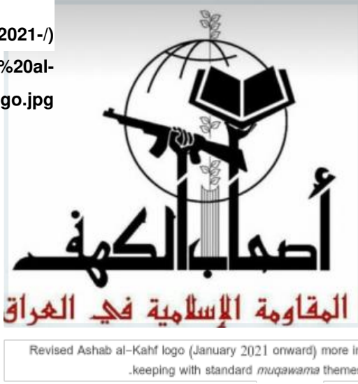
Revised Ashab al-Kahf logo (January 2021 onward) more in keeping with standard muqawama themes

المعركة بأن نطاق أهدافنا لا تقيد حدود «سايكس بيكو» الجائرة التي لم يكن الغرض منها إلا تسهيل استفراد المستعمرين ببلدان عالمنا الإسلامي". وهذا مؤشر على أن «كتاب صرخة القدس» تحاول توسيع عملياتها خارج العراق كما قدمت الجماعة شعاراً جديداً.