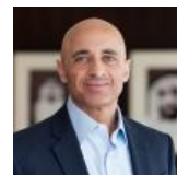
یوسف العتیبه ( fa/experts/ywsf-altybh/ )

یوسف العتیبه از سال ۲۰۰۸ به عنوان سفیر امارات متحده عربی در آمریکا خدمت کرده و وزیرخارجه دولت امارات بوده است.