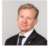
جان إيجلاند (/ar/experts/jan-aylund/)

جان إيجلاند هو الأمين العام لـ "مجلس اللاجئين النرويجي".