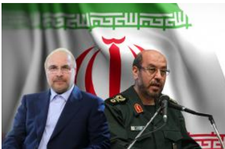
The 2021 Iranian Presidential Election A Preliminary Assessment (/policy-analysis/2021-iranian-presidential-election-preliminary-assessment)