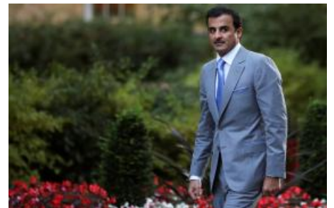
تطر بدون تميم سلسلة مقالات الخلافة المفاجئة (ar/policy-analysis/qtr-bdwn-tmym-slsit-mqalat-alkhlaft-almfajyt/)