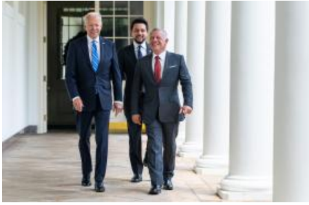
Preparing for Orderly Change in Jordan When the Time Comes (/policy-analysis/preparing-orderly-change-jordan-when-time-comes)