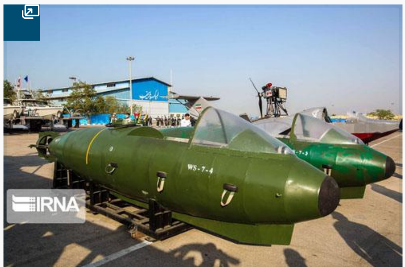
نمایی دیگر از السابحات.