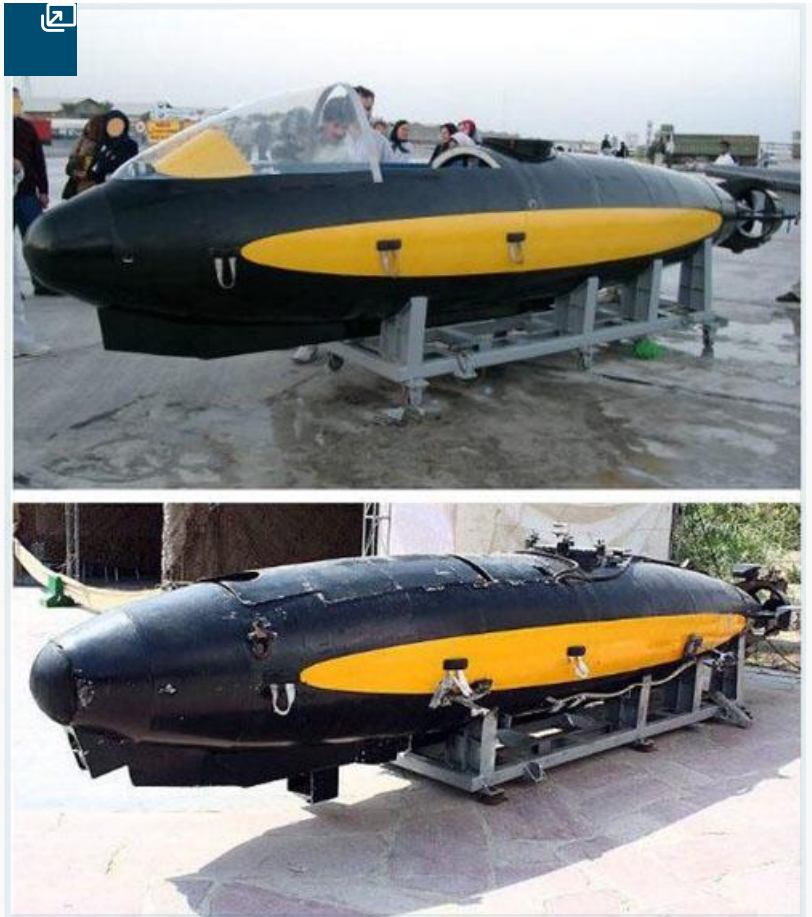
یک شناور سرنشین‌دار السابحات برای انتقال غواص (تصویر بالا سال ۱۹۹۹) که به نمونه بی‌سرنشین همین شناور (تصویر پایین ۲۰۱۹) تبدیل شده است