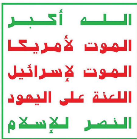
Figure 4. Houthi Slogan

In translation, the Houthi slogan reads, "Allah/God is greatest, death to America, death to Israel, curse the Jews, victory to Islam."