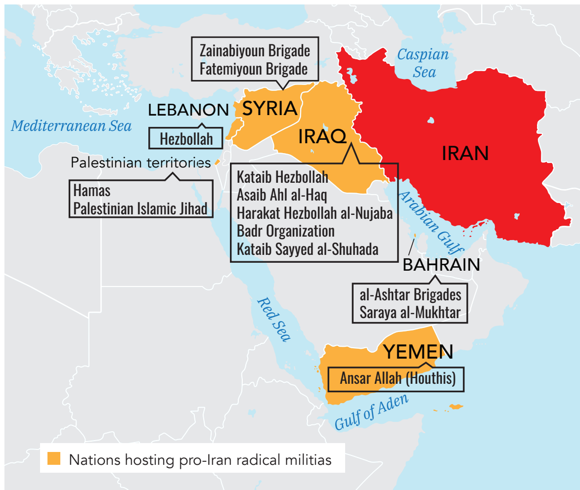
Figure 1. Iran and Its Proxies

באמצעות אסטרטגיה זו הפכה איראן לכוח דומיננטי, מרתיע, מעצב ומשפיע על משטרים במדינות שהבולטות שבהן הינן סוריה, עיראק, לבנון ותימן שם השכיחה איראן לנצל את המלחמות והסכסוכים הפנימיים על מנת להעמיק את השפעתה הפוליטית, כלכלית וצבאית.