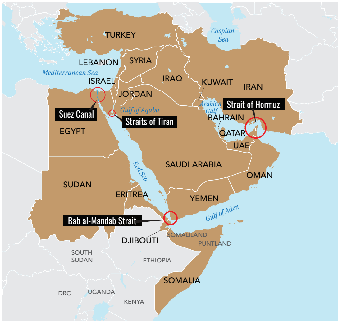
Figure 5. Bab al-Mandab Strait and Arabian Gulf

ה. באפגניסטן ובפקיסטאן ישנה אוכלוסייה שיעית חשובה אשר חלקה מהווה פוטנציאל השפעה, ומקור לגיוס מתנדבים-לוחמים ל"צבא האזורי". כתוצאה מהלחימה המתמשכת באפגניסטאן, מיליוני אפגאניים-שיעים המהווים קבוצת מיעוט בארצם ברחו למחנות פליטים באיראן. פליטים אלה היו מקור זמין לגיוס צעירים למשה"מ, ולבניית מיליציות לוחמות (2) שהבולטת שביניהן מכונה בשם 'פאטמיון' (Fatemiyoun Division). דיביזיית ה'פאטמיון' האפגאנית המונה על פי ההערכות כ-10000 פעילים (3) ודיביזיית ה'זינביון' (Zaynabiyoun) הפקיסטאנית, אף נוידו ללחימה בסוריה והשתתפו בקרבות מרכזיים להגנה על המשטר נגד המורדים ונגד ארגון "המדינה האסלאמית". שתי הדיביזיות מהוות כוחות ניידים קלים וחלק מ"הצבא האזורי". מרכיבים מהדיביזיות האפגאנית הפקיסטאנית חונות בבסיסים איראניים בסוריה קרוב לגבול עיראק, וחלקם נשלחו למחנות באיראן ומהווים כוח התערבות אזורי זמין.