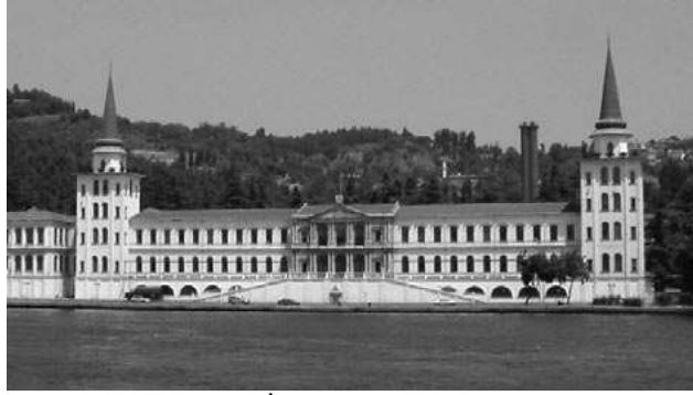
1845 yılında kurulan İstanbul'daki Kuleli Askeri Lisesi Batılı ve seküler müfredata göre eğitim ve öğretim yapmak için kurulan birkaç Osmanlı askeri okulundan bir tanesiydi.

Kaynak: Türkiye Ekonomik ve Sosyal Etüdler Vakfı, Değişen Türkiye'de Din, Toplum Ve Siyaset (İstanbul: Türkiye Ekonomik ve Sosyal Etüdler Vakfı, Aralık 2006), sayfa 58