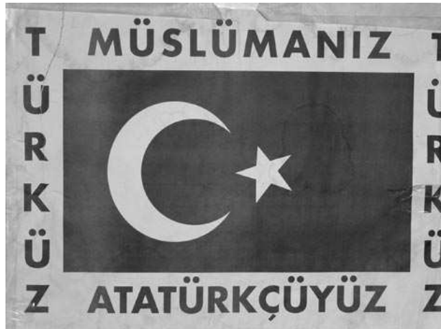
Yazar tarafından Temmuz 2005'te Bursa'nın Emirhan mahallesinde çekilen bu resim, kimi Türk vatandaşlarının Müslümanlığı kimliklerinin ayrılmaz bir parçası olarak