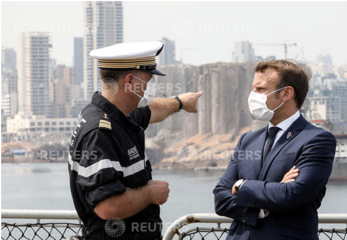
Washington Institute – Octobre 2020 - Le président Emmanuel Macron s'entretient avec un officier de la marine française au regard de la ligne d'horizon de Beyrouth et de l'épave, suite à l'explosion d'août 2020.